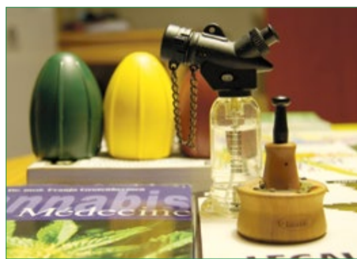
le Vapman

Les amateurs de beaux objets pratiques et efficaces, comme le couteau suisse, ré-