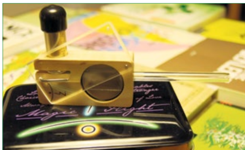
le MFLB

Avec une pratique régulière, le MFLB se révèle un outil indispensable. Il n'y a pas de surchauffe et quelques bouffées suffisent à être efficaces.